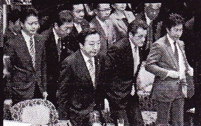
「剛腕、が消費増税で 宣戦布告

されなかった。調書を作ったのは東京地検特捜部の田代政弘検事（現・新潟地検検事）。上司に報告するための捜査報告書では、石川氏が発言していない内容を複数の部分に盛り込んだ。捜査報告書は検察審査会が小沢氏を強制起訴する際の