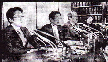
「無罪」に自信の弁護団