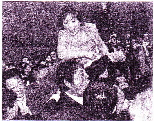
議員院うゆう森・士闘女かかるり厚に田大仁