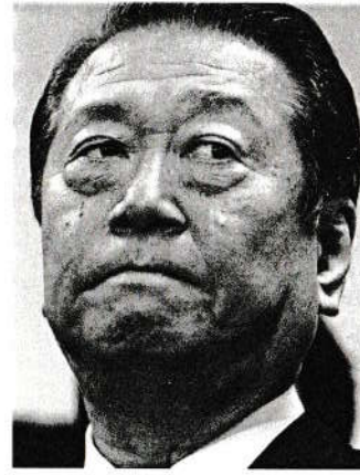
▲東京第5検察審査会の2度にわたる起訴議決によって強制起訴されたものの、無罪となった小沢一郎議員

5検察審査会の検察審査員はそもそも存在していなかった」「起訴議決自体が、架空議決だった」とする、その根拠を徹底検証していくこととする。 というのも志岐氏がそのような見解を示しているのに対し、森前議員は東京第5検察審査会が開かれたことを前提に「検審の起訴議決は検察の捏造報告書によって誘導されたもの」と公言。両者間の争いの根っこにはこうした決定的な主張の違いがあるからだ。 それを背景に志岐氏は森前議員について「肝腎の最高裁への追及がなくなったのだ」（森氏にしてみれば）